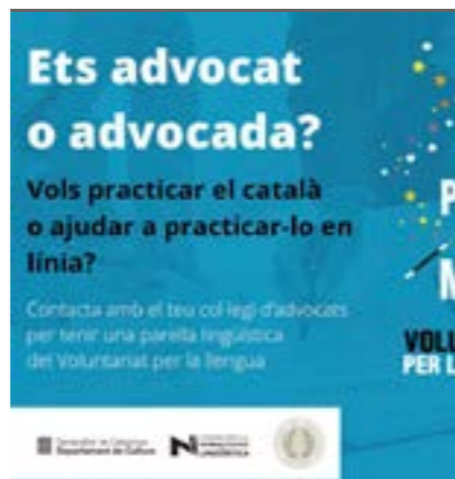
Voluntariat per la llengua.