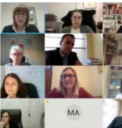
Taula rodona "Les dones i món laboral."