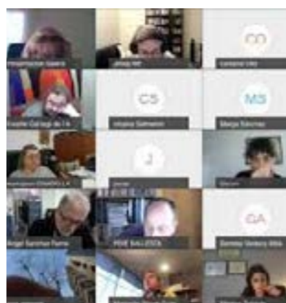
Darreres sessions de Formació.