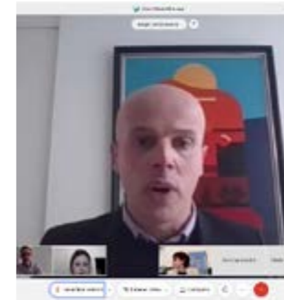
Primera Junta General Ordinària 2021.