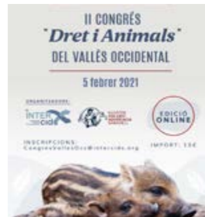
II Congrés de Dret Animal.