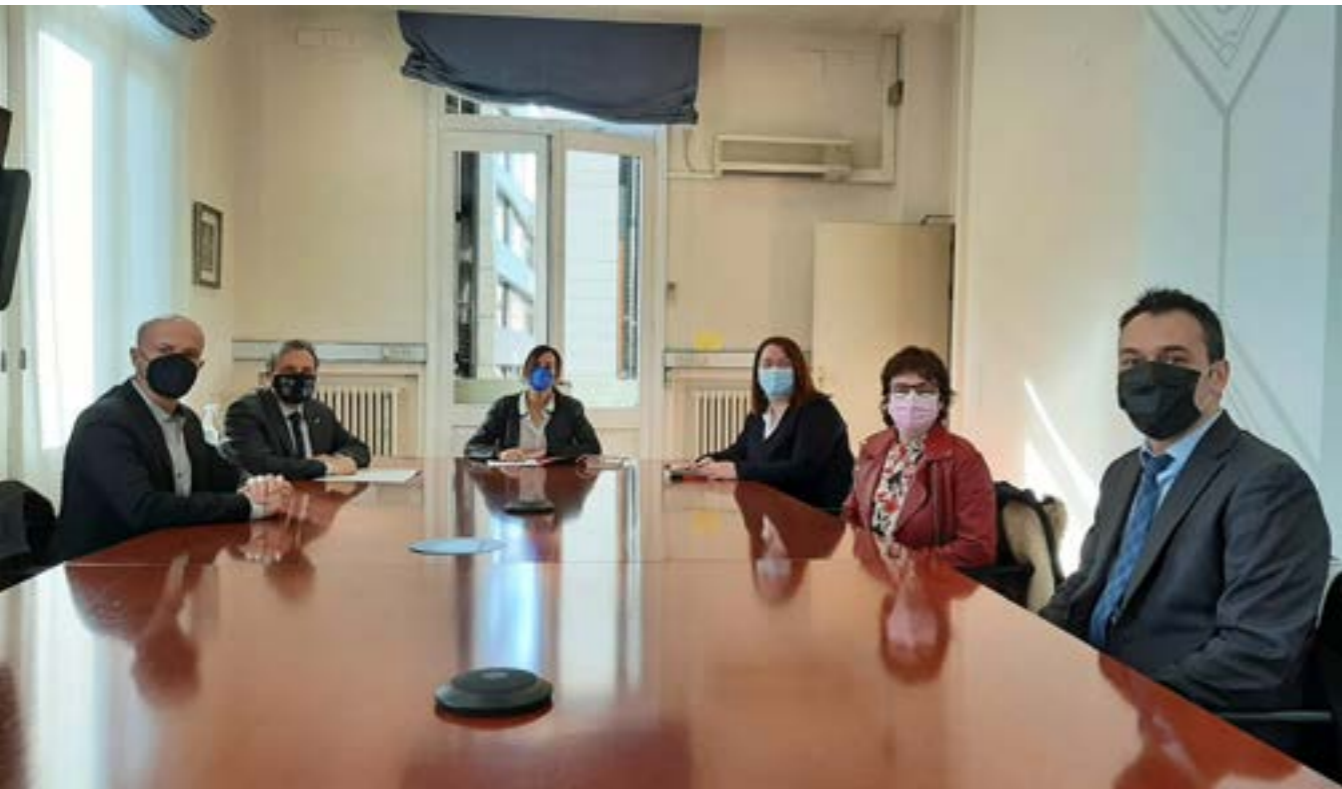
Reunió amb l'Alcaldessa de Sabadell, Marta Farrés.

E l primer trimestre d'activitat de la nova Junta de Govern de l'ICASBD ha servit per iniciar una ampla ronda de contactes amb institucions i administracions per tal de presentar el nou òrgan de govern col·legial i reprendre temes de gran interès pel nostre col·lectiu.