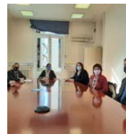
Presentació de la nova Junta a les institucions.