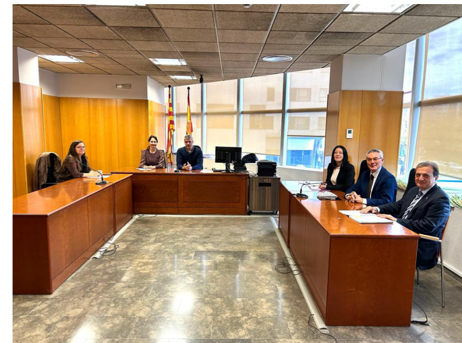
A la pàgina anterior, moment de la sessió formativa sobre mediació celebrada el passat octubre. Sota aquestes línies, imatge d'una recent reunió celebrada amb la jutgessa degana de Sabadell a la seu dels jutjats.

Es redueix el dany emocional, això és, s'evita que les parts es facin mal