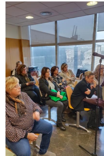
Moment de la sessió pràctica de mediació celebrada el passat 1 de febrer a l'edifici dels Jutjats de la ciutat de Sabadell, en format de roleplay.

En el marc d'aquesta jornada memorable, el Col·legi de l'Advocacia de Sabadell va desplegar una gamma diversa d'activitats amb l'objectiu de donar visibilitat i fomen-